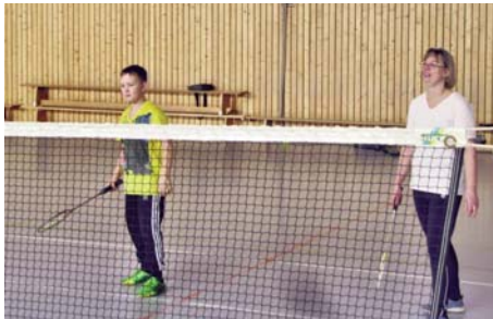
Badminton Schnuppertag: das Spiel erfordert volle Konzentration

Auch in diesem Jahr findet jeden Montag in der Neetzer Sporthalle (von 18:00 Uhr bis 20:30 Uhr) Badminton statt. In den Ferien ist badmintonfreie Zeit.