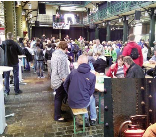
In der Fischauktionshalle geht die Post ab. Es spielen ununterbrochen Live-Bands.