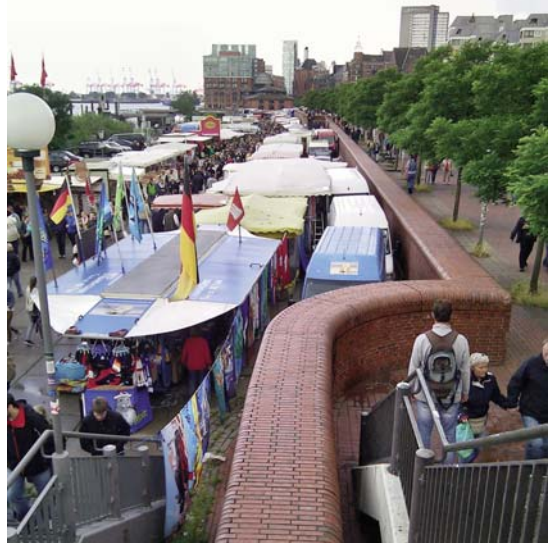
Auf dem Fischmarkt reiht sich Bude an Bude.