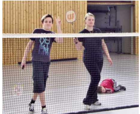
Badminton Schnuppertag: die Spieler hatten eine Menge Spass

Es gibt 5 Spielfelder, die zum Teil nicht voll genutzt werden. Also, wer Lust zum Badmintonspielen hat, kann gerne kommen und mitspielen.