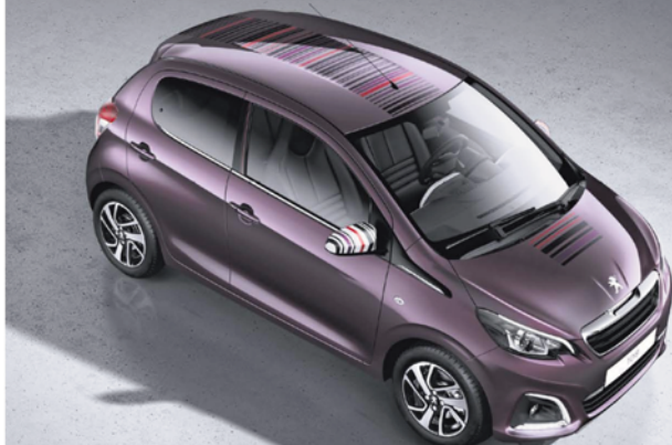
Abb. enthält Sonderausstattung.