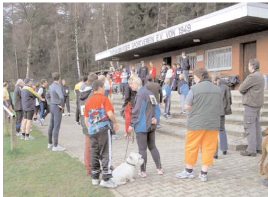
Eine Rede vom 2. Vorsitzenden B Bisanz ...

Ein Dank geht an die Thomasburger Jugendfeuerwehr und die zahlreichen freiwilligen Helfer.