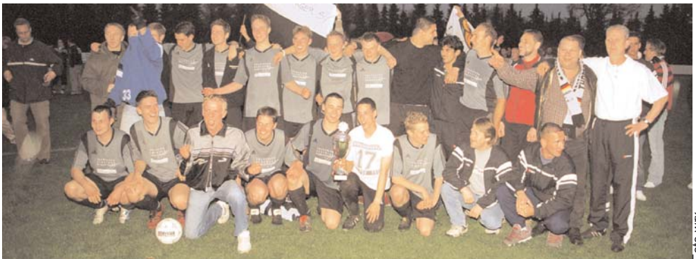
Die Mannschaft nach dem Gewinn des Kreispokals