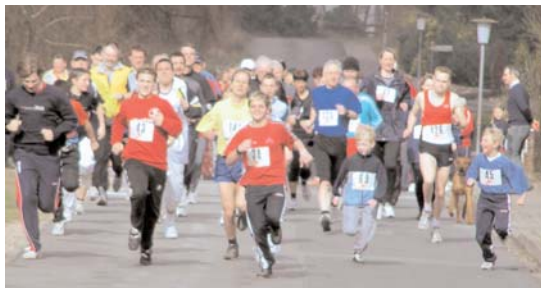
... und dann geht es endlich los