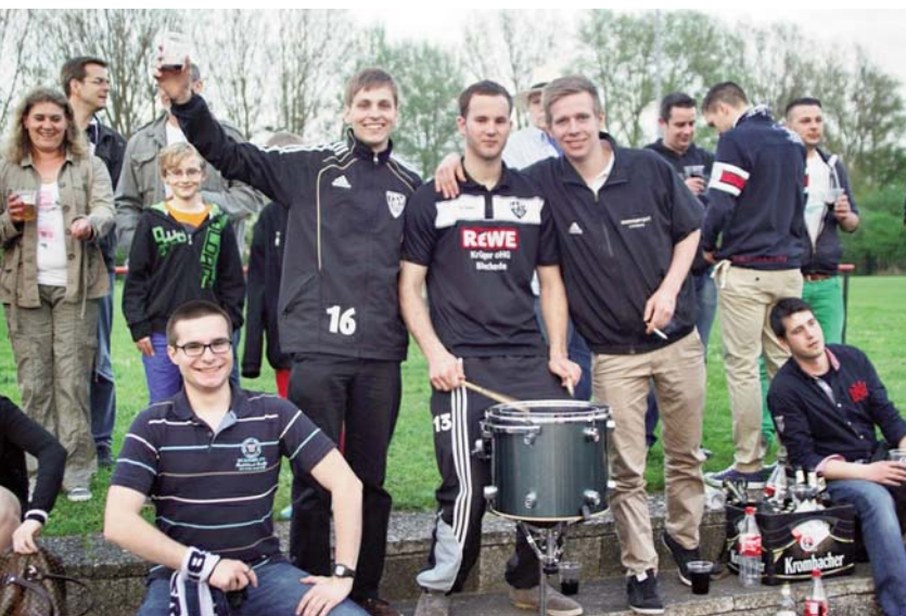
Die Thomasburg Ultras

Mo - Fr 6.30 - 20.00 Sa 7.00 - 20.00 So 8.00 - 20.00