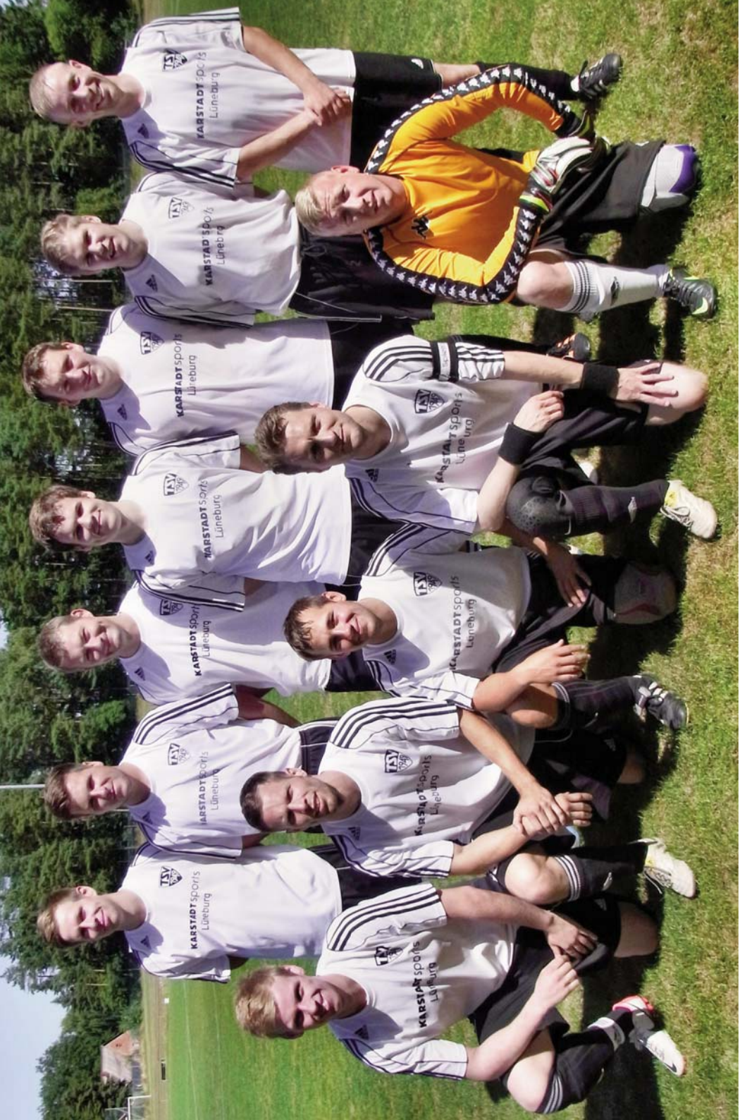
Thomasburger SV, Herren 2013/2014 Namen auf Seite 13