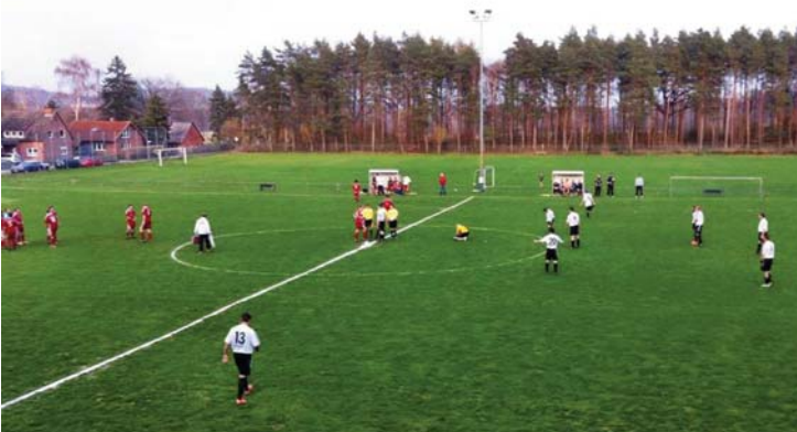
Vor dem Spiel gegen Soderstorf

doch noch zum Ausgleich und hätte durch einen Foulelfmeter auch noch in Führung gehen können, doch Ingo Hoffmann war zur Stelle und parierte den Strafstoß. So ging es ins Elfmeterschießen, man könnte sagen: Wie immer. Und auch dieses wurde gewonnen mit 5:4, wie immer.