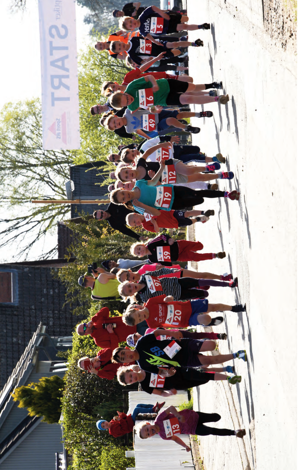
Kurz nach dem Start des Bambini-Laufes