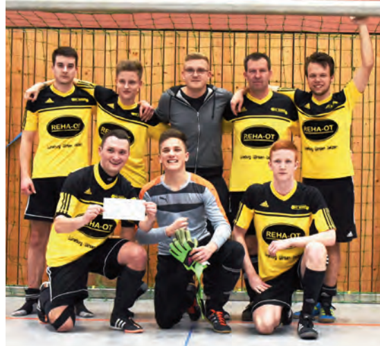
Der FC Echem siegte beim Reserventurnier