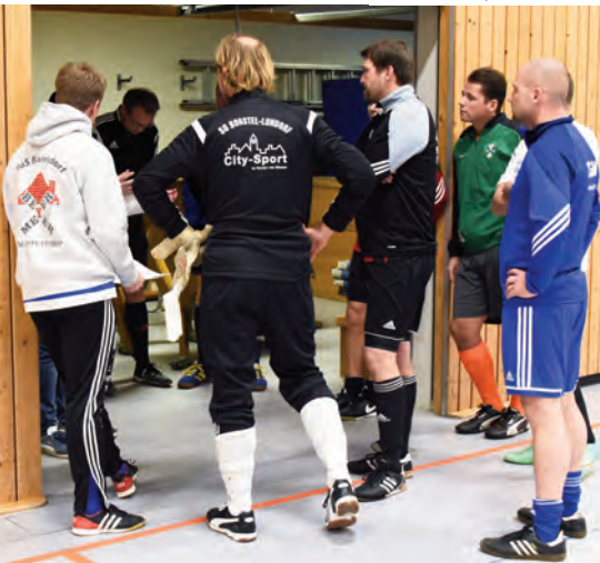
Besprechung der Kapitäne vor dem Alte Herren-Turnier.