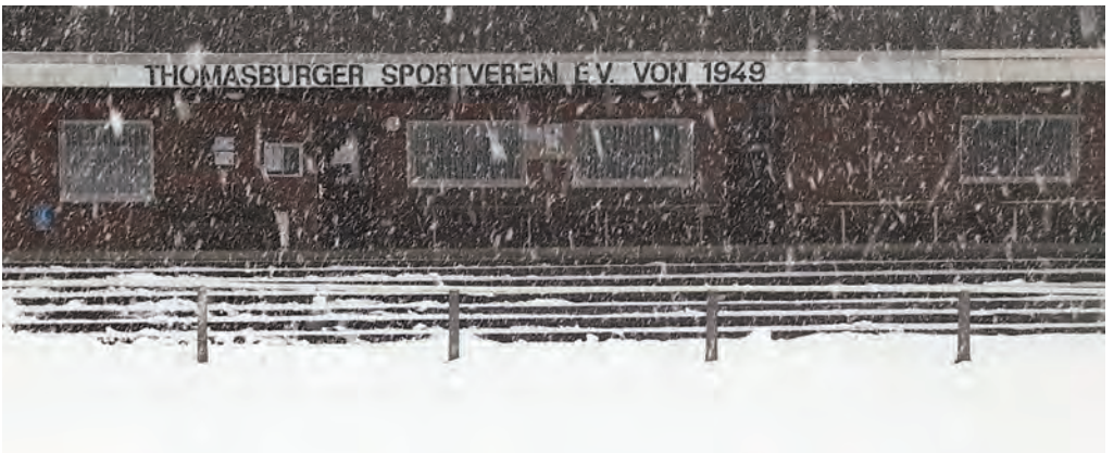
Regen, Frost und Schnee sorgten für eine lange Winterpause