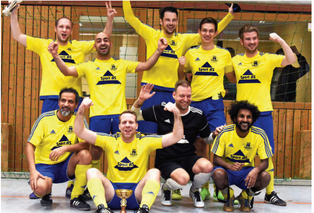
Sieger des Herrenturniers: Der ESV Lüneburg