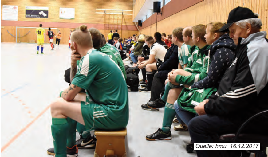
Die vielen Zuschauer verfolgen das Geschehen