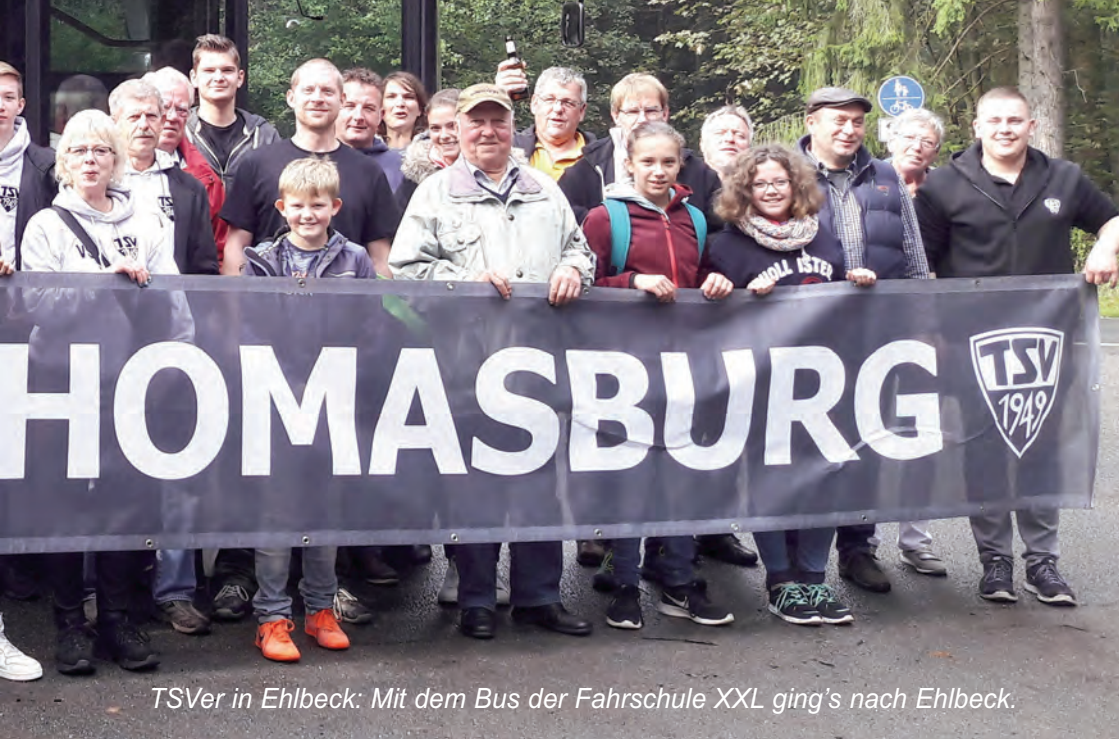
TSVer in Ehlbeck: Mit dem Bus der Fahrschule XXL ging's nach Ehlbeck.