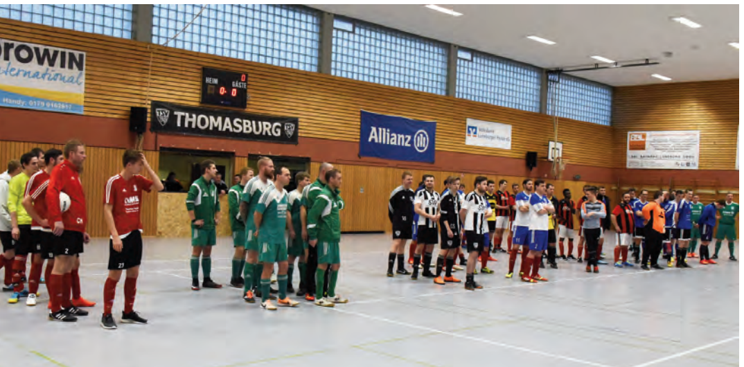
Antreten der Reserventeams