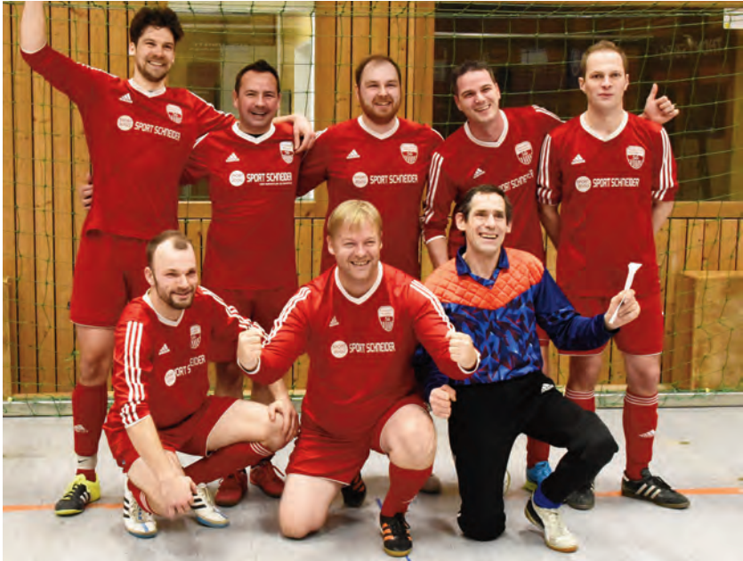
Sieger bei den Alten Herren: SG Scharmbeck-Pattensen