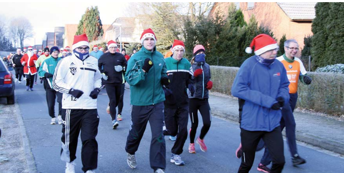
Die Läufer führten nach kurzer Zeit das Feld an ....

Schon mal vormerken: der diesjährige Punschlauf findet am 27.12.2015 statt.