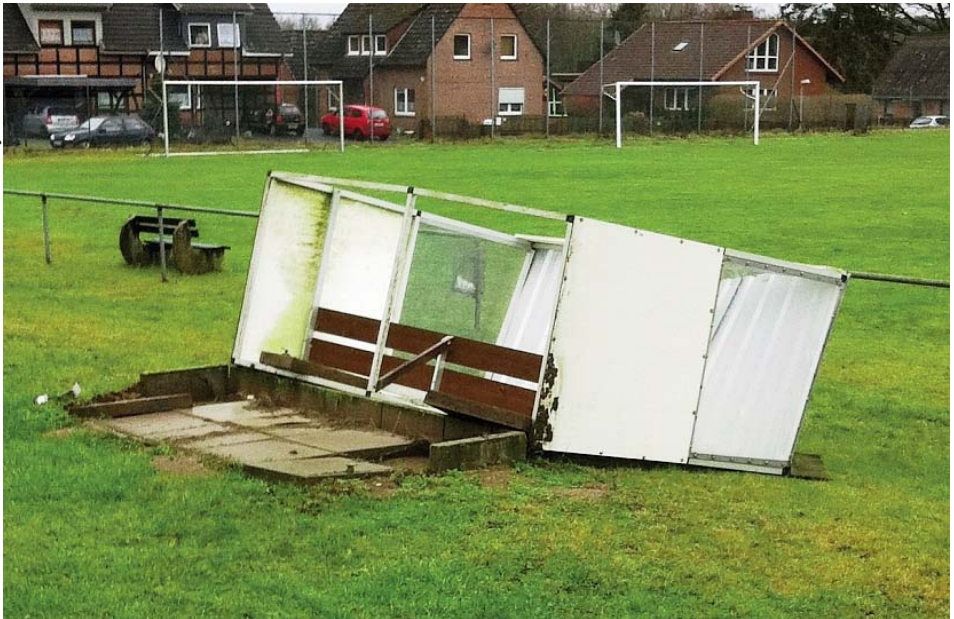
Sturmschäden im Januar 2015